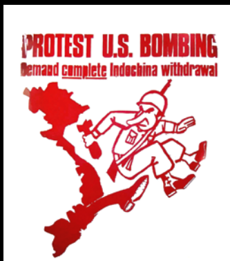
Plakat aus Australien

Die Ursachen für die globale Protestbewegung der «1968er» sind vielfältig. Eine weltweite Konstante waren die Proteste gegen den US-Krieg in Vietnam. Mit der «Tet-Offensive» ab dem 31.1.1968 synchronisierten sich die Proteste und gaben ihr eine vielsprachige politische Signatur. Die Ausstellung zeigt eine Vielzahl an Original-Plakaten aus dem National Museum of History of the Socialist Republic of Vietnam, die 2015 in Hanoi unter dem Titel «The world support for the Anti-American Resistance War of Vietnam's people» gezeigt wurde. Sie dokumentieren die weltumspannenden Proteste gegen den Vietnamkrieg und legen auch einen vergleichenden Blick auf die «Propagandaposter» dieser Zeit frei. Von der Sowjetunion bis zu den USA, aus DDR und BRD zeigt die Ausstellung 24 Plakate. In Westberlin fand am 17./18. 2.1968 die «Vietnamkonferenz» statt, deren Bilder ikonografisch für die 1968er Bewegung stehen und Ausdruck des starken Bezugs der Bewegung auf Vietnam.